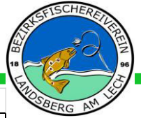
Gesamtfänge 2015 mit Vergleich 2009 bis 2014 (Gewichte in kg)