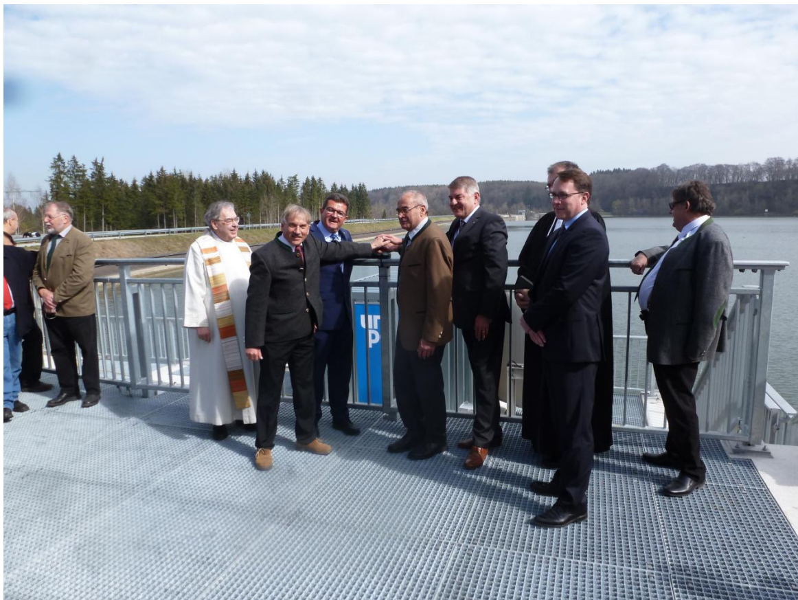
Einweihung der Fischaufstiegsanlage Lechstaustufen 18/19 am 4. 4. 2016.