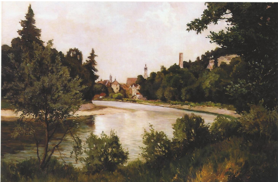
Lech bei Landsberg, Öl auf Leinwand, ca. 1930, Adolf Reidel